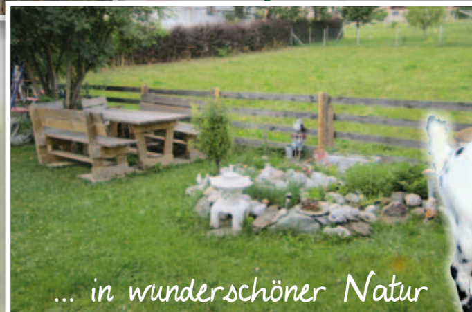
... in wunderschöner Natur