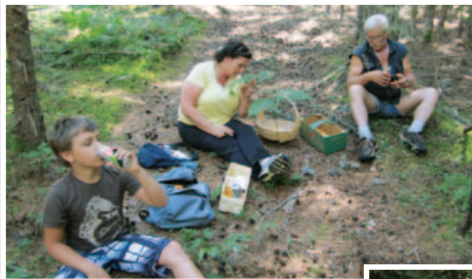
Gemeinsame Ausflüge und Feiern