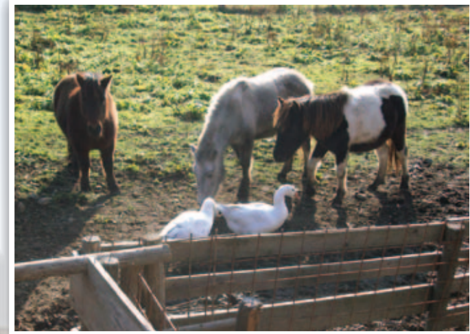
Mensch und Tier begegnen sich auf unserer kleinen Tierfarm