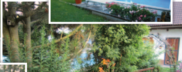
Zeit für sich ...