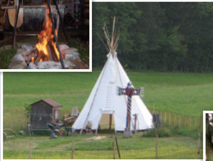
Tipizelt mit Lagerfeuerromantik